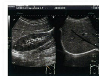
実際の画像(腎臓・肝臓)