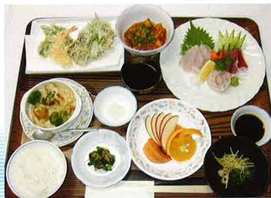
(天ぷら、お刺身、和え物、果物、汁物、ご飯等)