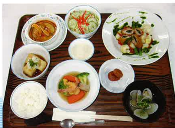
(ヒレカツ、煮物、酢の物、漬物、汁物、ご飯等)

入院ドックを受診される方は、お食事をご用意してお待ちしております。季節の食材を使い、おいしく満足していただけるよう工夫しております。